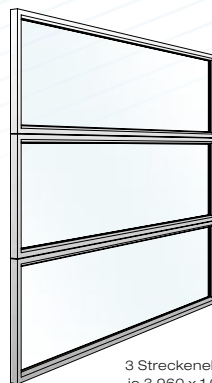
3 Streckenelemente je 3.960 x 1.000 mm

Elementgröße 1.960 x 3.000 mm, Aluminiumrahmen 70/63, beschichtet in RAL 9006, Scheibenmaterial Acryl, Typ KOHLHAUER Clearview®, klar, 15 mm, inkl. 8 Klemmschrauben zur Befestigung im Pfosten